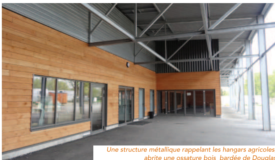
Une structure métallique rappelant les hangars agricoles, abrite une ossature bois bardée de Douglas

taurant scolaire, école, périscolaire et associations, pour optimiser les surfaces,