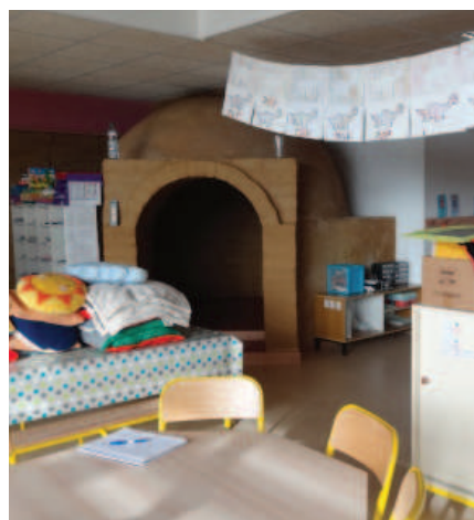
Des classes fonctionnelles, avec vestiaires, sanitaires et espace de repos intégrés